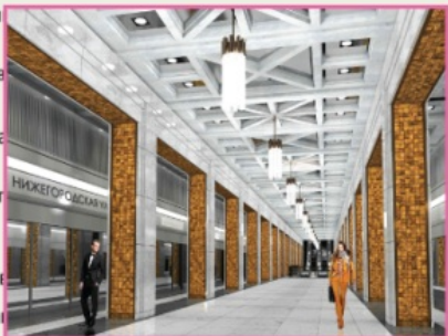
Станция «Нижегородская улица» Расчетная нагрузка: 400 тыс. чел./сутки