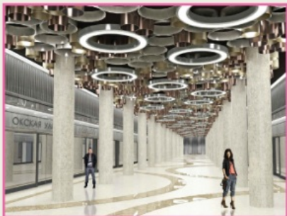
Станция «Окская улица» Расчетная нагрузка: 140 тыс.чел./сутки