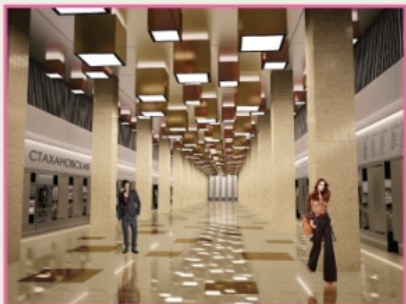
Станция «Стахановская» Расчетная нагрузка: 100 тыс. чел./сутки